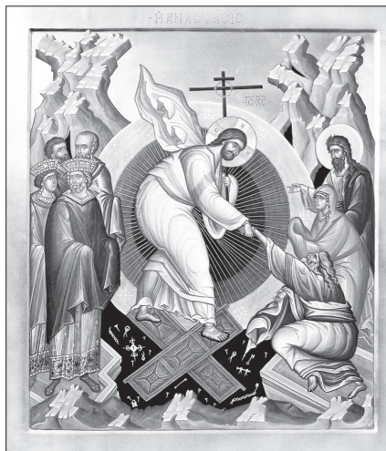
Воскресение Христово. Сийская иконописная мастерская.

27 апреля — Великая Среда. На Литургии Преждеосвященных Даров после «Буди Имя Господне...» три великих поклона обычно с молитвой прп. Ефрема Сирина, после чего земные поклоны прекращаются до дня Святой Троицы (кроме поклонов у Святой Плащаницы).