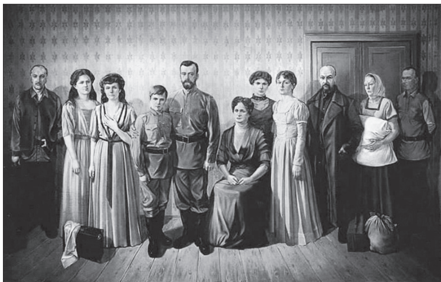
Перед расстрелом. Художник П.А. Мурахин.